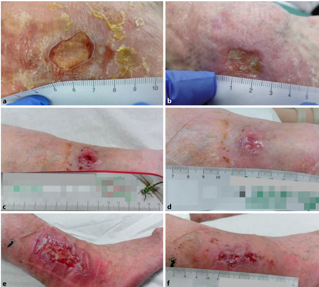
Abb. 1 ◀ Behandlung verschiedener Wunden mit Enzym-Alginogelen. a Venös-arterielles Ulcus cruris vor der Behandlung und b nach 2-wöchiger Behandlung. c Infiziertes Hämatom nach Sturz: Wunde vor Behandlungsbeginn und d nach 1-wöchiger Behandlung. e Ulcus cruris venosum vor der Behandlung und f nach 18-tägiger Behandlung

[5, 7, 33]. Geringe Konzentrationen genügten, um klinisch relevante antibiotikaresistente Bakterienstämme abzutöten, ein zytotoxischer Effekt auf Keratinozyten und Fibroblasten blieb aus.